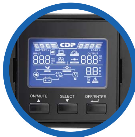
Panel LCD con rotación de 90°