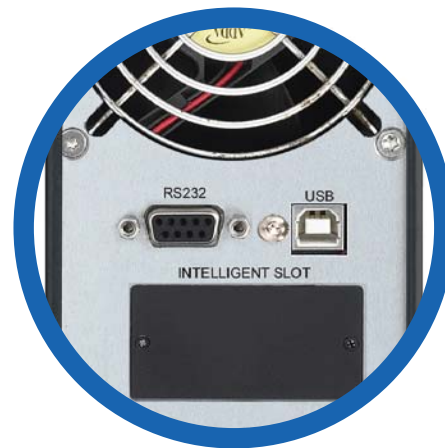
Puertos de comunicación