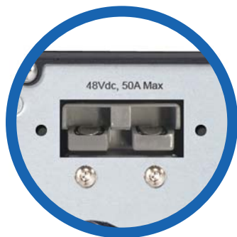
Conector para bancos de baterías externo