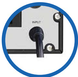
Cable de alimentación CA