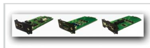
Tarjetas opcionales SNMP y de control