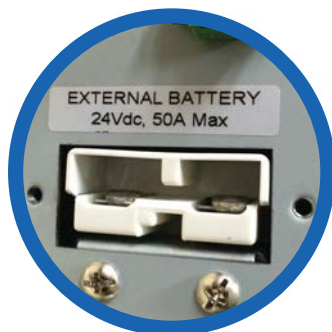
Entrada banco de baterías externas

4 terminales NEMA 5-15R, de los cuales 2 son programables