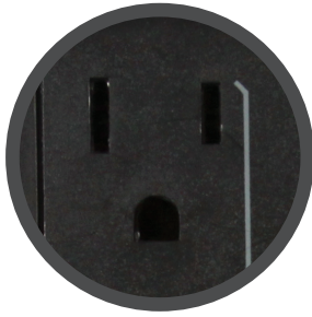
8 Tomas de salida. [4 con AVR - Supresión de picos 4 solo con supresión]

El nuevo y avanzado Regulador de Voltaje Automático R2C, el más completo y de mejor calidad. Este nuevo producto ofrece 8 tomas de salidas, corrige bajas y altas tensiones y proporciona un regulado de 120VCA.