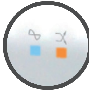
Pantalla LED oculta.