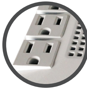
8 Tomas con protección de sobretensión y protección AVR.